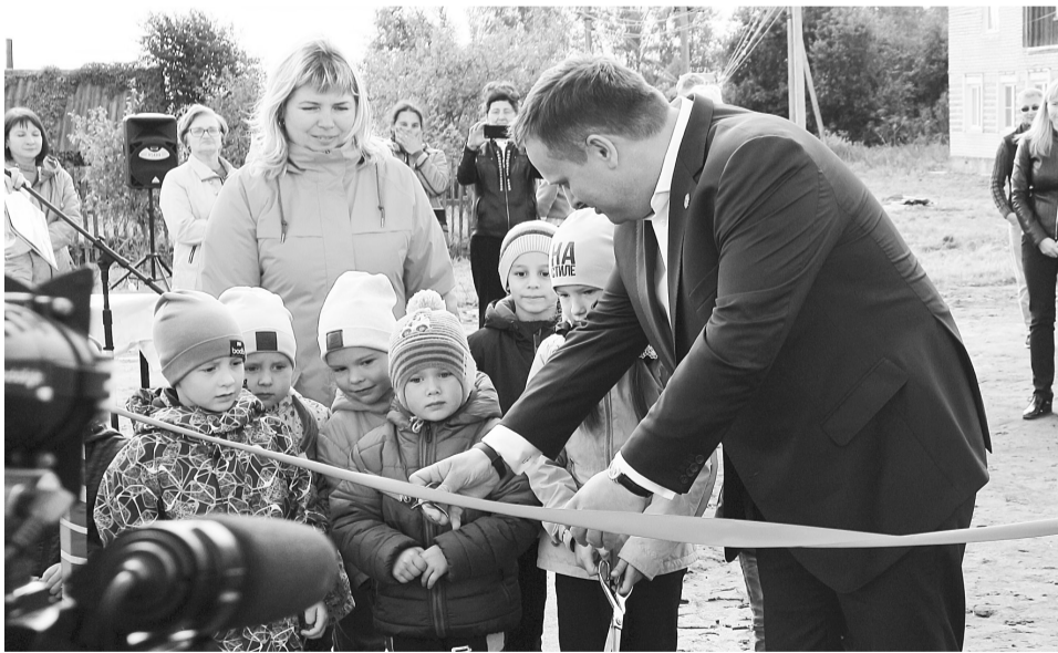
Глава региона предлагает детсадовцам поучаствовать в торжественном открытии детской площадки

В деревне Коегоща Сушанского поселения торжественно открыли детскую площадку, установленную по проекту поддержки местных инициатив. Это первый опыт участия поселения в ППМИ.