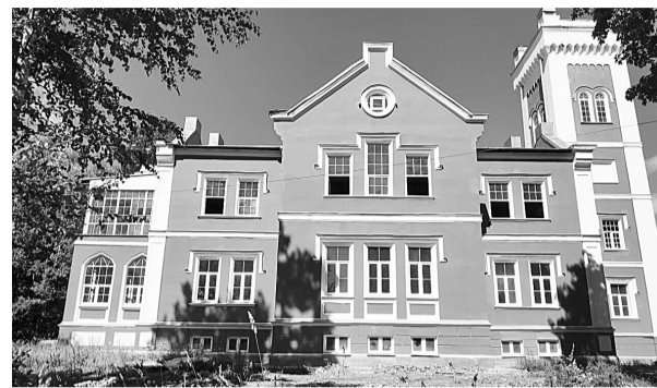
Благодаря комбинату огнеупоров усадьба помещика Неклюдова обрела вторую жизнь

Глава региона Андрей Никитин посетил усадьбу Неклюдова в местечке Гверстанка, реставрацией которой занимается комбинат огнеупоров.