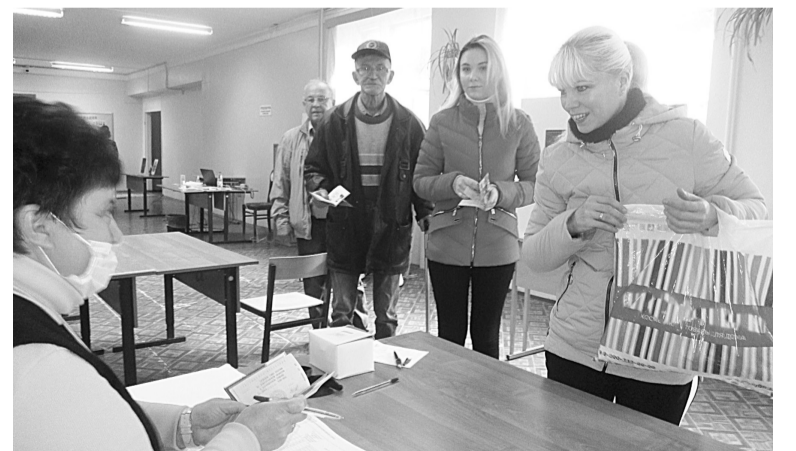
Голосование на избирательном участке в 8-й школе