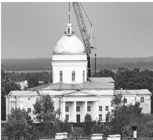
Троицкий собор теперь виден издали

На Троицкий собор установили главный купол, увенчанный крестом.